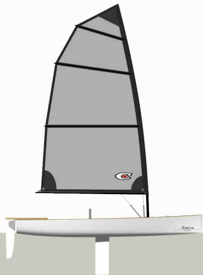
SOFT WING 5.8

superficie 5.8 mq altezza albero 4.45 m lunghezza bottom 2160 mm lunghezza top 2290 mm materiale pentex costruzione a pannelli orizzontali _per bambini e meno esperti _fino a 25kn di vento