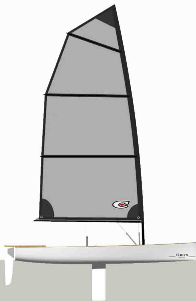
COOL WING 6.8

superficie 5.8 mq altezza albero 4.45 m lunghezza bottom 2160 mm lunghezza top 2290 mm materiale pentex costruzione a pannelli orizzontali _per bambini e meno esperti _fino a 25kn di vento